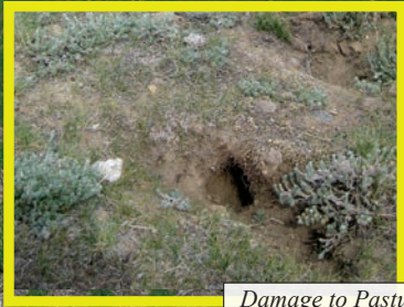
Damage to Pasture