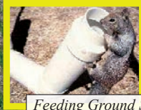
Feeding Ground Squirrel