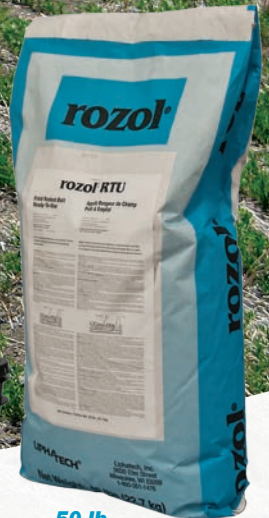
50 lb. (22.7kg) bag