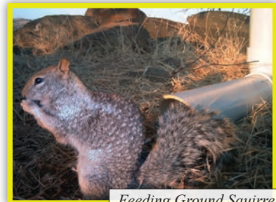
Feeding Ground Squirrel