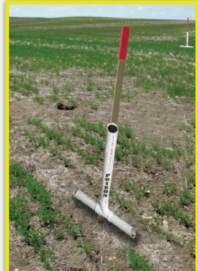
Bait stations are an Effective Baiting Tool for Ground Squirrels