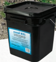
20 lb. (9kg) pail